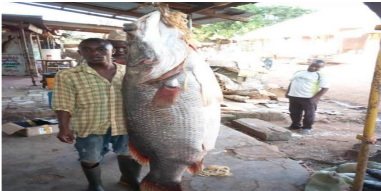
Kuongezeka kwa wingi na ukubwa wa samaki aina ya Sangara kutokana na juhudi za serikali za kudhibiti uvuvi na biashara haramu ya Rasimali za Uvuvi