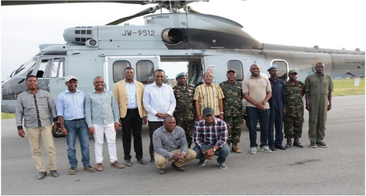
Timu maalum ya Mawaziri nane (8) kwa ajili ya kutatua migogoro ardhi kutoka Wizara za kisekta ikiwemo Ofisi ya Rais TAMISEMI, Ofisi ya Makamu wa Rais - Mazingira, Wizara ya Mifugo na Uvuvi, Wizara ya Ardhi, Nyumba na Maendeleo ya Makazi, Wizara ya Maliasili na Utalii, Wizara ya Maji, Wizara ya Kilimo, Wizara ya Katiba na Sheria (Ofisi ya Mwanasheria Mkuu wa Serikali)