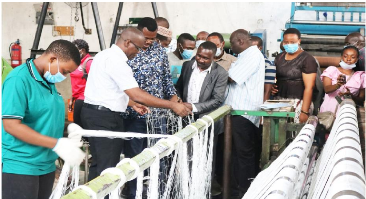
Ukaguzi wa ubora wa nyavu katika kiwanda Star Fish kilichopo Vingunguti - Dar es Salaam