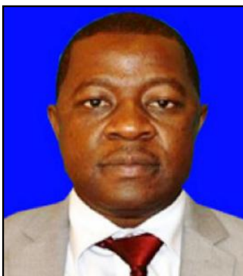
MHE. ABDALLAH HAMIS ULEGA NAIBU WAZIRI WA MIFUGO NA UVUVI