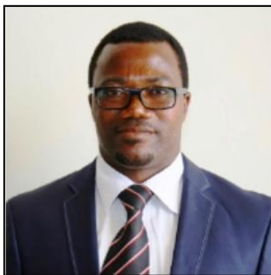
MHE. LUHAGA JOELSON MPINA WAZIRI WA MIFUGO NA UVUVI