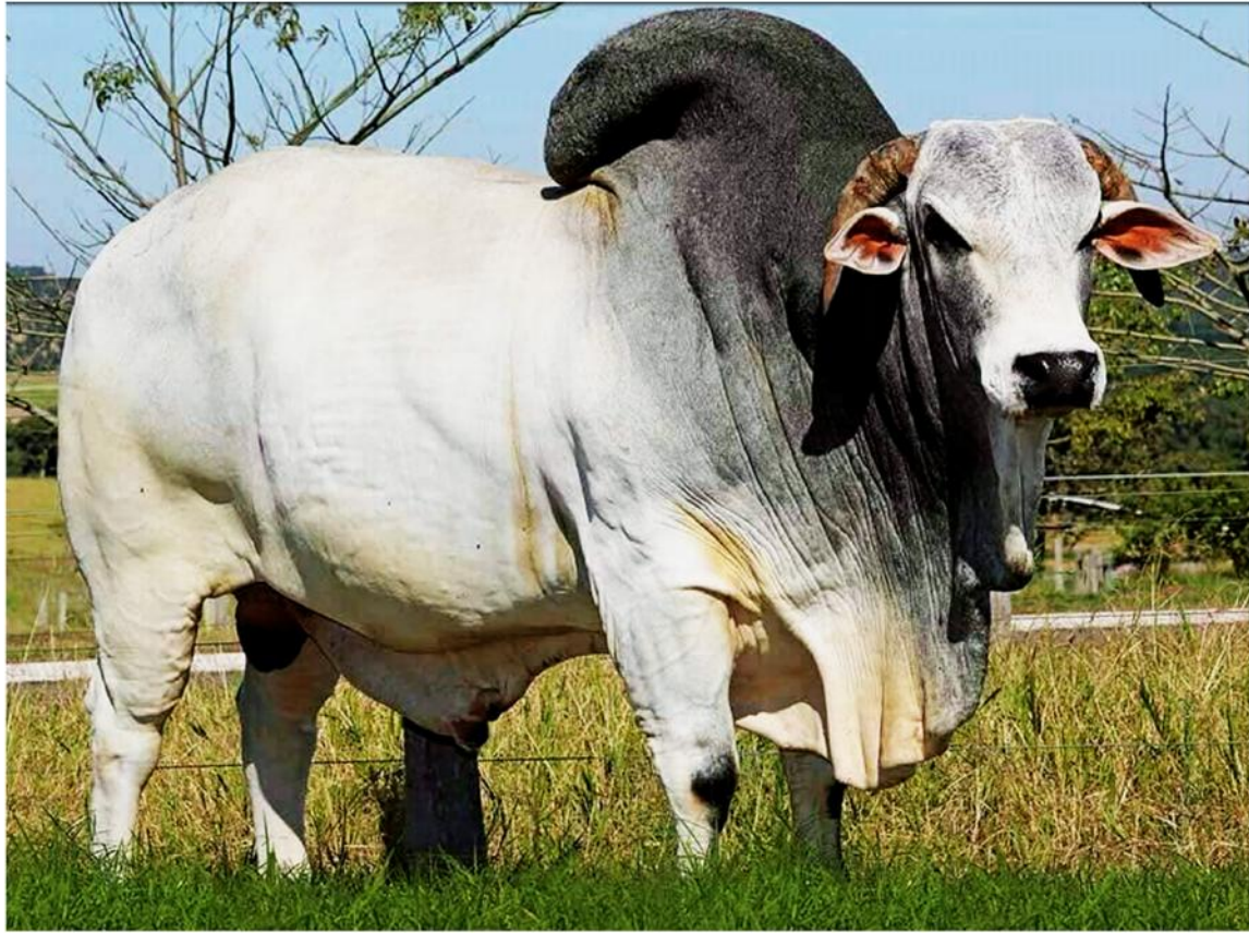
Ng'ombe dume aina ya Sahiwah (Nzagamba)